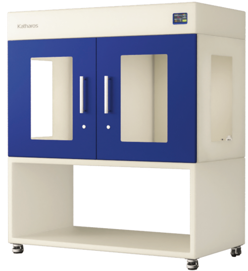
ZEO-PUS152 / ZEO-SPS152