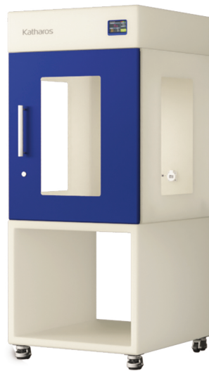
ZEO-PUS151 / ZEO-SPS151